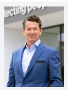
Winter, Michael UVEX WINTER HOLDING GmbH & Co. KG