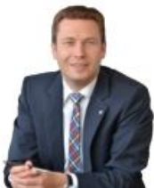
Landrat des Landkreises Fürth