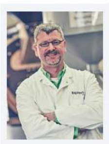
Sulzer, Reiner Espressone GmbH