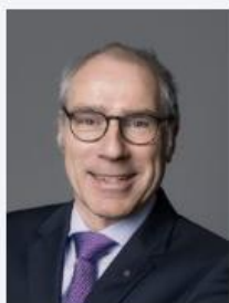
Amm, Lothar Amm GmbH