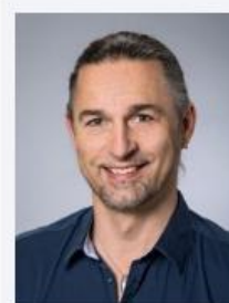
Rajtmajer, Alojz Loisl's Eiskonzepte