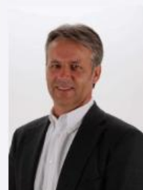
Bruder, Paul Heinz Bruder Spielwaren GmbH + Co. KG