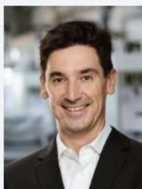
Dr. Badock, Christoph Hoefler & Sohn GmbH