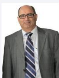
Graf, Wilhelm Feser, Graf & Co. Automobil Holding GmbH