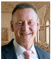
Oberbürgermeister Stadt Fürth