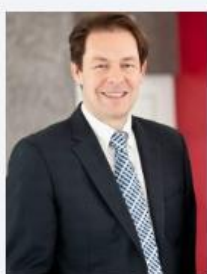
Lehrieder, René Lehrieder Catering-Party- Service GmbH & Co. KG