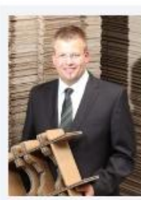
Wattenbach, Peter Paul Lindner GmbH