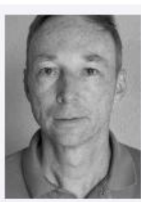
Deinhard, Norbert Hörgeräte Hörluchs GmbH & Co KG