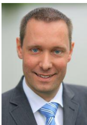
Landrat Nürnberger Land Armin Kroder, Freie Wähler