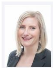
Amann, Katharina Amann GmbH & Co. KG