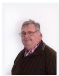
Wild, Jürgen Schaustellerbetriebe Wild