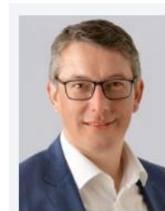
Nentzler, Andre ebalta Kunststoff GmbH