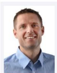
Schneider, Achim Schneider Druck GmbH