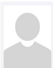
Pehl, Stephan Hans Pehl u. Sohn GmbH & Co. KG