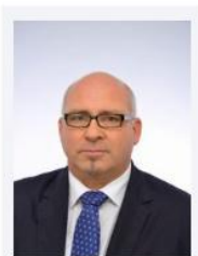
Uhl, Friedrich Neuberger Gebäudeautomation GmbH