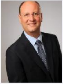
Aßmann, Bernd Joh. Leupold GmbH & Co. KG