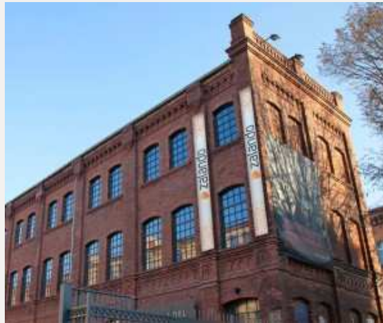
Marke: Zalando „stationär“