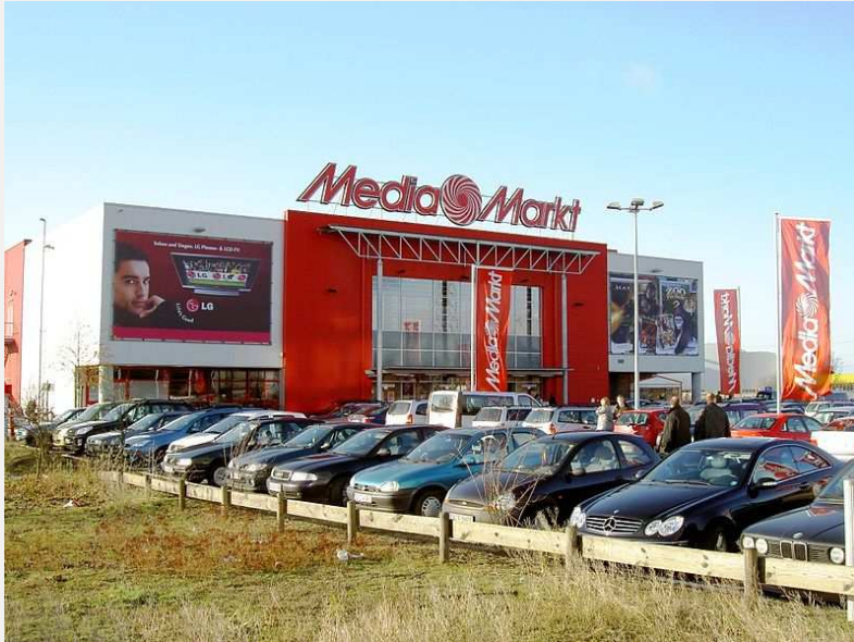
Grüne Wiese: Größe