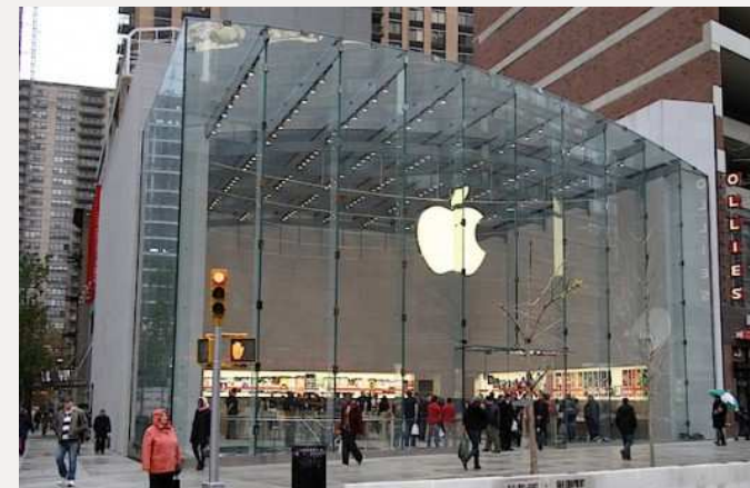
Architektur: Apple Store New York