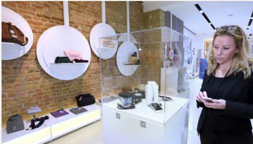
Lage: ebay Showroom Berlin

Ostbayerische Technische Hochschule Amberg-Weiden