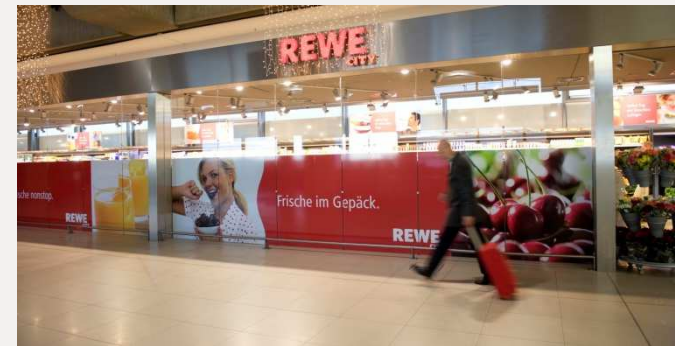
Zeit: REWE City