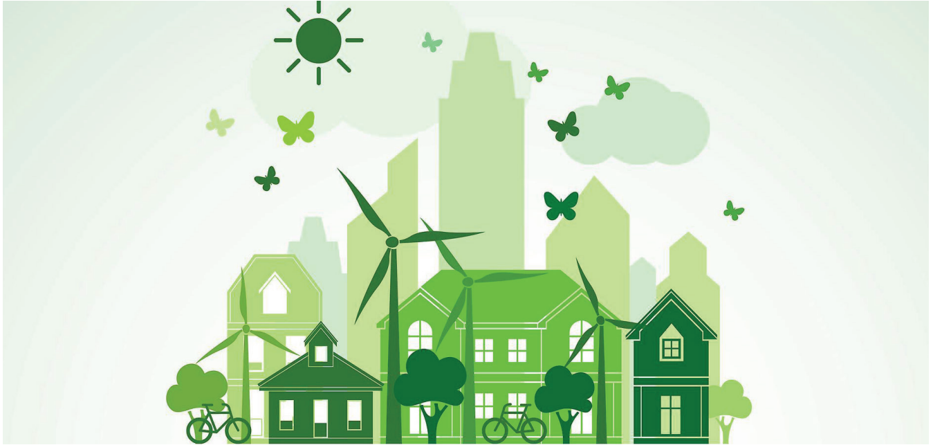
Abbildung: Titelbild der IHK-Umfrage „Klimaschutz im Betrieb“