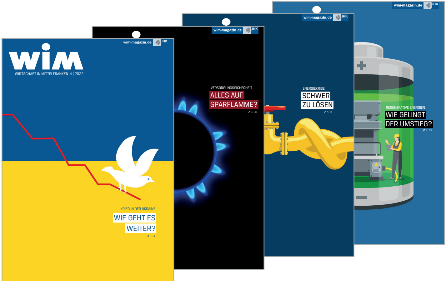
Abbildung: Ausgewählte Titelbilder des IHK-Magazin „Wirtschaft in Mittelfranken“ aus dem Berichtszeitraum 2022-2023 (v.l.: WiM 04|2022, WiM 07|2022, WiM 10|2022, WiM 04|2023).

In der WiM wird regelmäßig über die Dimensionen von Nachhaltigkeit mit dem Zusatz „im Wirtschaftsleben“ berichtet.