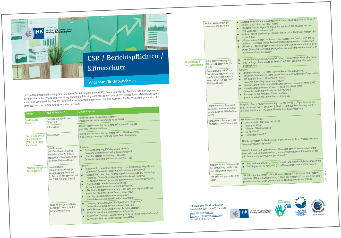
Abbildung: Zusammenfassung der vielfältigen IHK-Aktivitäten (mit Stand Juni 2023) in puncto Nachhaltigkeit für das Parlament der Wirtschaft (die IHK-Vollversammlung) in Mittelfranken.