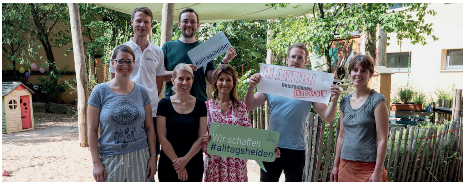
Abbildung: Mitarbeiterinnen und Mitarbeiter der IHK Nürnberg beim Social Day 2023.

Jährlich nimmt die IHK an der Aktion „Stadtradeln“ teil und legte im Jahr 2023 3.337 km zurück. Dabei kommt jede mit dem Fahrrad gefahrene Strecke nicht nur dem Klima zugute, sondern auch der Gesundheit und Lebensqualität aller Nürnbergerinnen und Nürnberger. Zusätzlich unterstützt sie Pendlerinnen und Pendler mit dem VGN-Firmen-Abonnements bzw. wird zukünftig das Deutschlandticket mitfinanzieren.