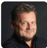
Uwe Ritzer Süddeutsche Zeitung

19:30 Uhr Zusammenfassung (Uwe Ritzer) und Ausblick (Markus Löttsch) anschließend Get Together mit Werte-Talks